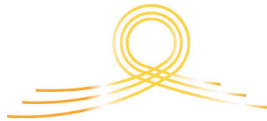
LES FILS D'OR DE L'ACCOMPAGNONNAGE.

Toute collectivité qui s'adapte aux changements et adopte des solutions adéquates fonctionne comme un organisme vivant parmi d'autres organismes vivants. Le soutien mutuel est requis sur le pont de l'évolution. Le premier qui s'élanche déclenche l'effet d'entraînement.